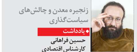
زیچیره معدن و چالش های سیاست گذاری

رئیس مرکز پژوهش‌های مجلس سهم هزینه های مسکن در سبد خانوارهای شهری ایران را ۶۰ تا ۷۰ درصد خواند و تاکید کرد: این در حالی است که میانگین این شاخص در جهان ۱۸ درصد است و در دامنه نوسانات حدودا ۱۵ تا ۲۵ درصد است.