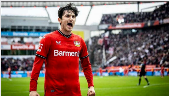
ملی‌پوش ایرانی را بفروشد. باشگاه آلمانی به دنبال این است که از فروش آزمون بیش از ۱۰ میلیون یورو درآمدزایی داشته باشد.

خاوبر ریباتا (مدیر ورزشی اسپانیایی تیم مارسسی) در زینت سن‌پترزبورگ واقعا از آزمون حمایت کرد و خود او اولین گفت‌وگوها را با اطرافیان مهاجم و باشگاه جدیدش بایرلورکوزن، که تا سال ۲۰۲۷ با آن قرارداد دارد، آغاز کرد. حالا هم این اسپانیایی در کنار شناخت بالای ایگور تودور - سرمربی کروات مارسسی - دلایل محکمی برای انتقال احتمالی سردار به این تیم بندرتشین فرانسوی دارد. از طرفی عملکرد ضعیف ویتینیای پرتغالی که ژانویه از براگا به مارسسی رفت هم مزید بر علت شده تا تیم فرانسوی انتقال آزمون را جدی‌تر از قبل دنبال کند. سردار به جز مارسسی از المپیک لیون فرانسه و فتریاغچه ترکیه نیز پیشنهاد دارد و در نهایت باید منتظر ماند و دید که چه آینده‌ای در انتظار ستاره ایرانی خواهد بود. با وجود تمام این اخبار و شایعات نباید فراموش کنیم که او اخیراً در مهم‌ترین بازی فصل مقابل رم به طور کامل برای تیم ژایی آلونسو به میدان رفت، بنابراین نباید ماندن او در بای آرنه را هم به طور کامل منتفی تلقی کرد.