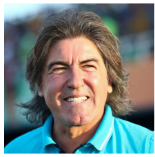
ساینپتو به الغرافه قطر می‌رود

یک رسانه یونانی خبر داد ریکاردو ساینپتو با باشگاه الغرافه قطر مذاکره کرده و احتمالاً جایگزین سرمربی پرتغالی این تیم می‌شود. ریکاردو ساینپتو سرمربی پرتغالی استقلال بعد از پشت سر گذاشتن یک فصل پرفراز و نشیب در این تیم، سرانجام ایران را ترک کرد. ساینپتو نه تنها در مسابقات لیگ برتر به جام نرسید و بعد از پرسپولیس و سپاهان در رده سوم قرار گرفت که حتی در جام حذفی هم کاری از پیش نبرد و با قبول شکست برابر پرسپولیس در فینال، این قهرمانی را هم به رقیب دیرینه واگذار کرد. باخت استقلال به پرسپولیس در فینال، انتقادات از این مربی پرتغالی بالا گرفت و حتی سرپرست مدیرعاملی استقلال اعلام کرد که پیشنهاد ساینپتو را برای بالا رفتن مبلغ قراردادش نپذیرفته این در حالی است که ساینپتو هم شب گذشته تأکید کرد که همچنان منتظر باشگاه استقلال می‌ماند و قصد دارد یک فصل دیگر در این تیم مربیگری کند؛ هرچند که نشانه‌های باشگاه استقلال حاکی از این است که این قرارداد تمدید نخواهد شد.