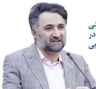
نقش آفرینی دانش‌بنیان‌ها در محرومیت‌زدایی