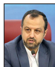
کمک به کاهش تنگنای تامین مالی