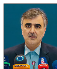
بیش از ۱۰۰ میلیارد دلار منابع ارزی داریم