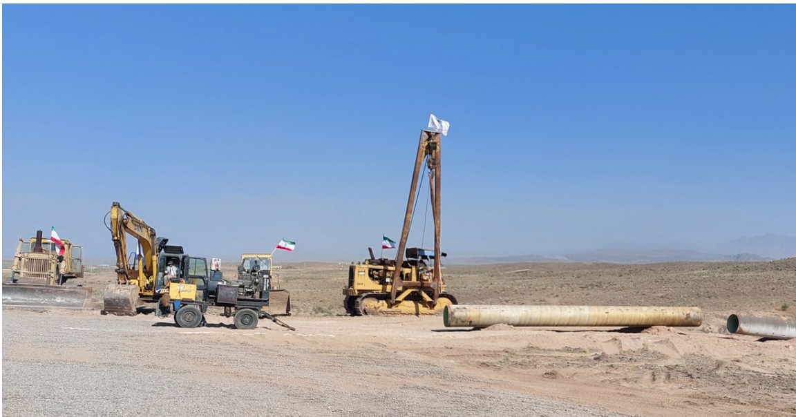
رئیس حوضه آبریز فلات مرکزی و حوضه‌های شرقی کشور گفت: دولت برای اجرای طرح آبرسانی شهرستان ساوه از سد کوچری ۲۵ هزار میلیارد ریال سرمایه گذاری می‌کند.