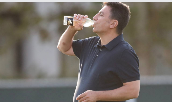
آسیا کاهش داده‌اند.

این نتایج همه را خوشبین کرده تا تیم ملی بعد از مدت‌ها در جام ملت‌های آسیا نتیجه بگیرد و عنوانی مهم به دست بیاورد. با این حال فدراسیون فوتبال هم برای اینکه کادرفنی با خیالی آسوده و آرامش کامل در این تورنمنت مهم شرکت کنند، قرارداد امیر قلعه‌نویی را تا پایان جام جهانی ۲۰۲۶ تمدید کرده. قراردادی که البته مشروط است و یک بند مهم در آن گنجانده شده.