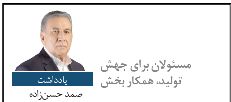
مسئولان برای جهش تولید، همکار بخش یادداشت