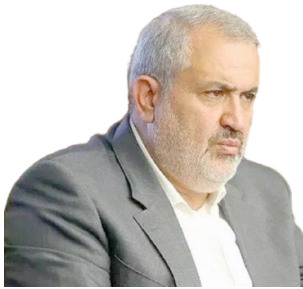
۱۳۳ هزار خودروی وارداتی ثبت سفارش شد