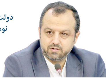
دولت هیچ نفعی از نوسانات نرخ ارز نمی‌برد