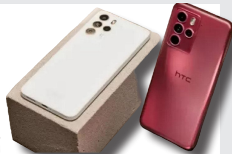
بعد از مدت ها غیبت، HTC با یک گوشی جدید به بازار برمی گردد

فاصله دارد و به مدل اچ تی سی Pro U23 نزدیک است. در مورد گوشی جدید HTC چه می دانیم؟ انتظار می رود این گوشی هوشمند از تراشه قدرتمند Snapdragon 3 Gen 7 کوالکام بهره ببرد که شامل یک پردازنده مرکزی هشت هسته ای و پردازنده گرافیکی مجتمع 720 Adreno می شود. همچنین 12 گیگابایت رم و سیستم عامل اندروید 14 از دیگر ویژگی های کلیدی آن هستند. با در نظر گرفتن تراشه Snapdragon 3 Gen 7 Pro U24/4 در U23 سال گذشته، می توان انتظار جهش قابل توجهی در عملکرد این گوشی که با شماره مدل 2QDA100 شناخته می شود، به احتمال زیاد جانشین HTC U23 سال گذشته خواهد بود و نام نهایی آن ممکن است HTC U24 یا Pro U24 باشد. نتایج بنچمارک Geekbench برای این مدل، امتیاز 1095 در بخش تک هسته ای و 3006 در بخش چند هسته ای را به نمایش می گذارد. این امتیازها نشان از یک میان رده قدرتمند دارد که کاملاً با گوشی اچ تی سی Pro 22 Desire دو سال پیش آن ها