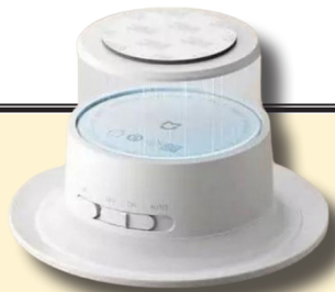
گجت جدید شیائومی یک چراغ خواب هوشمند است

شیائومی چراغ خواب هوشمند MIIA Night Light ۳ را در چین عرضه کرد. باتری لیتیومی این گجت تا ۸ ماه بدون نیاز به شارژ مجدد کار می کند. کمپانی شیائومی که در عرضه انواع گجت‌ها و لوازم خانگی تحت برند «میجیا» بدولای دارد به تازگی از سومین نسل چراغ خواب هوشمند MIIA Night Light رونمایی کرد. برخلاف مدل پیشین، این یکی طراحی گرد و زوایای قابل تنظیمی دارد که باعث پخش بهتر نور در محیط می شود. همچنین دارای