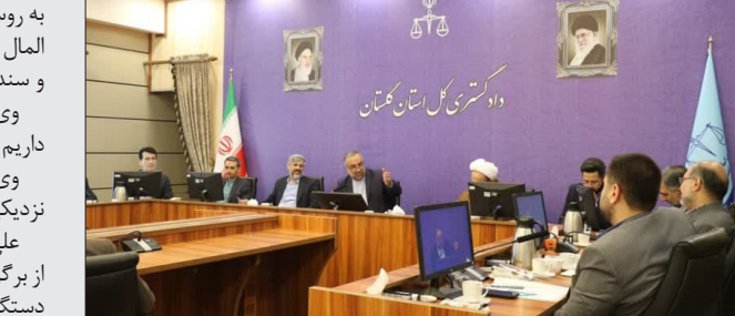
محل زندگی آنان است .

از عوامل اصلی کاهش تولید گندم محسوب می‌شود. کاهش قیمت خرید تضمینی گندم در سال‌های اخیر به دلیل افزایش هزینه‌های تولید و افزایش قیمت نهاده‌ها و همچنین کاهش سطح زمین‌های حاصلخیز و کمبود آب در برخی مناطق کشور، از جمله دلایل اصلی این روند است.