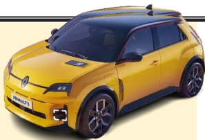
رنو ۵ برقی بهترین خودرو سال ۲۰۲۵ اروپا

هاجک رنو ۵ برقی با پشت سر گذاشتن رقبای اصلی خود توانست عنوان بهترین خودرو سال ۲۰۲۵ اروپا را با امتیاز قابل توجهی کسب کند. رتبه اول این خودرو، رتبه دوم را به جک (The Car of the Year) برای سال ۲۰۲۵ در هفته جاری برگزارد شد و سرانجام اسامی نامزدهای نهایی این رویداد توسط داوران اعلام شدند. هاجک جذاب رنو ۵ برقی توانست با پیشی گرفتن از سایر رقبای کسب و امتیاز قاطع، عنوان بهترین خودرو سال ۲۰۲۵ را با اقتدار کسب کند.