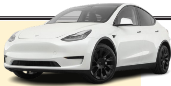
عرضه پر فروش ترین خودرو تسلا در آمریکا و اروپا

شرکت خودروسازی تسلا، نسخه جدید با قیمت بالاتر از مدل Y را هفته‌ها پس از اولین ارائه آن در چین پر فروش‌ترین خودروی خود را در روز پنجشنبه (۲۳ ژانویه) در ایالات متحده، کانادا و اروپا عرضه کرد. بر اساس وبسایت این شرکت در ایالات متحده، مدل Y جدید، یک نوع تمام چرخ محرک دوربرد است که ۵۹ هزار و ۹۹۰ دلار قیمت خواهد داشت که ۲۵ درصد بیشتر از مدل قبلی خود با قیمت ۴۷ هزار و ۹۹۰ دلار است. نسخه جدید مجهز به نرم افزار کاملاً خودران تحت