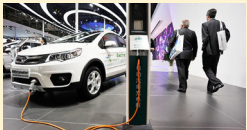
افتتاح نخستین خط هوشمند شارژ سریع خودروهای برقی

این خط تست و کیفیت سنجی هوشمند شارژهای سریع و فوق سریع خودروهای برقی در شرکت مهندسی ساخت برق و کنترل مینا (مکو) راه اندازی شده است.