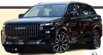
قیمت نهایی خودرو لوکانو L7 مشخص شد

گروه خودروسازی ماموت با همکاری شرکت مکث موتور به عنوان زیرمجموعه خود، طی مراسمی ویژه در محل شهرک صنعتی این گروه خودروسازی از قیمت نهایی کراس اور جدید و مونتاژی چری با نام لوکانو L7 پرده برداشت. این مراسم با حضور مدیران ارشد و نمایندگان برخی رسانه‌ها برگزار شد و جزئیات فنی و امکانات این خودرو نیز به طور کامل معرفی گردید. گروه خودروسازی ماموت در تاریخ ۲۷ بهمن ۱۴۰۳، قیمت نهایی کراس اور لوکانو L7 را مبلغ ۲ میلیارد و ۴۱۴ میلیون و ۲۰۰ هزار تومان اعلام کرده است. قیمت اعلام شده با