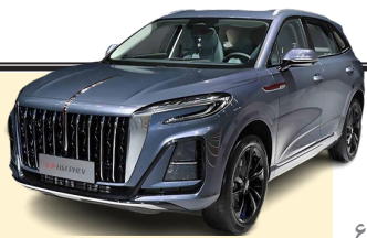
هونگی H3S؛ کراس اور جدید ایران خودرو

به تازگی متوجه شدیم که شرکت ایران خودرو قصد دارد تا کراس اور خوش ساخت هونگی اس ۳ - Hongqi H3S را به ناوگان محصولات خود اضافه کند. پس در ادامه با مشخصات فنی و قیمت احتمالی هونگی H3S ایران خودرو همراه شما خواهیم بود. این خودرو با گذشتن از تست‌های سخت‌گیرانه و تاییدیه‌های لازم، در نهایت به بازار عرضه خواهد شد. این خودرو با موتور ۱۶۰۰ سی‌سی و ۱۵۰ اسب بخار، قادر است تا ۱۰۰ کیلومتر در ساعت حرکت کند. همچنین، این خودرو دارای سیستم تعلیق پیشرفته و ترمزهای قدرتمند است. اگر قصد خرید این خودرو را دارید، پیشنهاد می‌کنیم که به نمایندگی ایران خودرو مراجعه کنید.