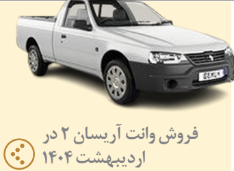
فروش وانت آریسان ۲ در اردیبهشت ۱۴۰۴

شرایط فروش وانت آریسان ۲ از سوی گروه ایران خودرو برای اردیبهشت ماه ۱۴۰۴ با قیمت جدید اعلام شد. جزئیات بیشتر این طرح را در ادامه بخوانید. شرکت ایران خودرو با انتشار یک اطلاعیه جدید، شرایط فروش وانت آریسان ۲ را برای اردیبهشت ماه ۱۴۰۴ اعلام کرد. کلیه متقاضیان می‌توانند از ساعت ۱۰ صبح روز سه شنبه مورخ ۱۶ اردیبهشت تا زمان تکمیل ظرفیت، نسبت به ثبت نام و واریز وجه اقدام کنند. در طرح فروش پیش رو، آبی پوشان جاده مخصوص