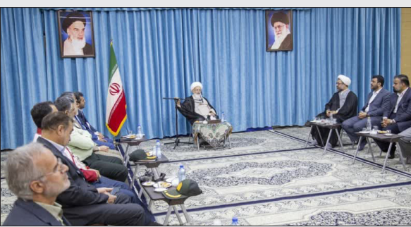
وی وظیفه کارگران حج را سنگین برشمرد و بیان داشت: کارگران حج موظف هستند

دیدار #کارگران حج و زیارت استان با نماینده ولی فقیه در استان و امام جمعه یزد