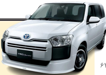
کاهش سود سالانه تویوتا با تشدید تعرفه‌ها

تویوتا موتور اعلام کرد در شرایطی که تضعیف دلار و تاثیر تعرفه‌های دولت ترامپ بر بزرگترین خودروساز جهان سنگینی می‌کند، این شرکت انتظار دارد سودش در سال مالی جاری به میزان یک پنجم (۲۱ درصدی) کاهش یابد. بر جدیدترین نمونه از اینکه چگونه اختلال تجارت جهانی، به سودآوری شرکت‌ها لطمه می‌زند، پر فروش‌ترین خودروساز جهان اعلام کرد که انتظار دارد در آمد عملیاتی در سال مالی منتهی به مارس ۲۰۲۶ به ۳۸ تریلیون یورو (۲۶ میلیارد دلار) برسد، در حالی که این رقم در سالی