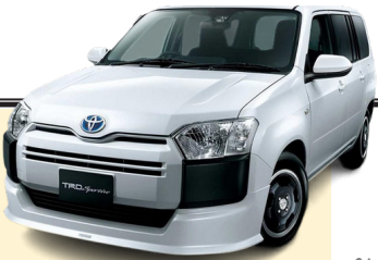
تعداد خودرو های تویوتا در دنیا چقدر است؟

به نظر شما در کل جهان و جاده های دنیا، چه تعداد یا بهتر بگوییم چند دستگاه خودرو از برند تویوتا در حال حرکت است؟ در این مطلب سعی می کنیم تعداد حدودی ماشین های تویوتا در دنیا را حدس بزینیم. شرکت تویوتا موتور، غول خودروسازی ژاپن، به تازگی آماري شگفت انگیزی را منتشر کرده که نه تنها نشان دهنده سلطه تاریخی این برند بر بازار جهانی خودرو است، بلکه از یک تغییر استراتژیک