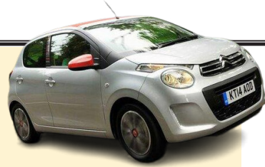
جمع آوری هزاران خودروی خطرناک سیترون

استراتژیست خواستار جمع آوری ۸۲ هزار دستگاه خودروی سیترون سی ۳ و دی اس ۲ حاوی کیسه‌های هوای معیوب تاکاتا از جاده‌های فرانسه شد. یک هفته پس از کشته شدن یک راننده زن بر اثر صدمات ناشی از ترکیدن کیسه هوای معیوب در یک سیترون سی ۳ مدل ۲۰۱۴، سخنگوی این شرکت روز پنجشنبه گفت که شرکت استراتژیست، برای جمع آوری ۸۲ هزار دستگاه خودروی سیترون مدل سی ۳