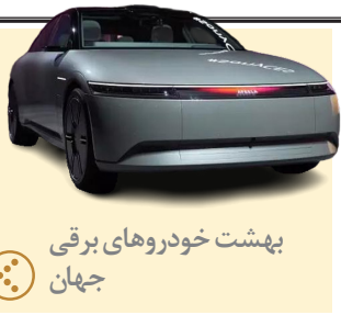
بهشت خودروهای برقی جهان

صاحب امتیاز: موسسه مطبوعاتی دانش پیام بامداد نوین مدیر مسئول: کریم حسن پور سر دبیر: جمشید بیرامی چاپ: جام جم آدرس: تهران، بلوار مرزداران، خیابان البرز، البرز یکم، پلاک ۶ تلفن: ۰۲۱-۴۹۱۰۵۰۰۰ Gmail: Avaayeeghtesad@gmail.com گستره توزیع: سراسری شرکت توزیع: نشر گستر