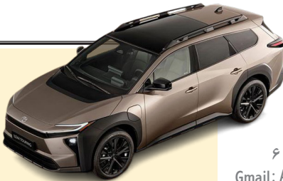
نان توپوتا و هوندا آجر شد

صاحب امتیاز: موسسه مطبوعاتی دانش پیام بامداد نوین مدیر مسئول: کریم حسن پور سر دبیر: جمشید بیرامی چاپ: جام جم آدرس: تهران، بلوار مرزداران، خیابان البرز، البرزیکم، پلاک ۶ تلفن: ۰۲۱-۴۹۱۰۵۰۰۰ Gmail: Avaayeeghtesad@gmail.com گستره توزیع: سراسری شرکت توزیع: نشر گستر