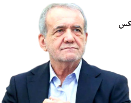
از ظرفیت بریکس و شانگهای استفاده کنیم