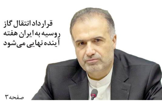
قرارداد انتقال گاز روسیه به ایران هفته آینده نهایی می شود