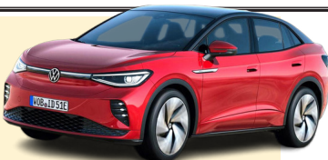
فولکس واگن ID، یک کراس اوور برقی کوچک

صاحب امتیاز: موسسه مطبوعاتی دانش پیام بامداد نوین مدیر مسئول: کریم حسن پور سردبیر: جمشید بیرامی چاپ: جام جم آدرس: تهران، بلوار مرزداران، خیابان البرز، البرزیکم، پلاک ۶ تلفن: ۰۲۱-۴۹۱۰۵۰۰ گستره توزیع: سراسری شرکت توزیع: نشر گستر