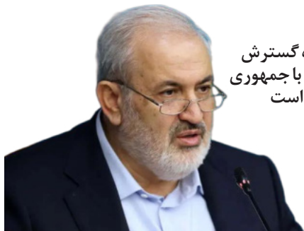
ایران آماده گسترش همکاری‌ها با جمهوری آذربایجان است