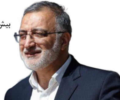
بیش از ۵۱ درصد مردم تهران مستأجرند