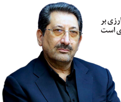
سیاست‌گذاری ارزی بر عهده بانک مرکزی است