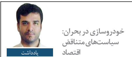
خودروسازی در بحران: سیاست‌های متناقض اقتصاد