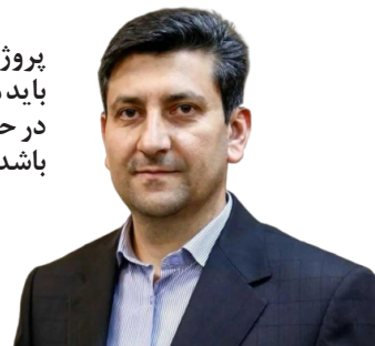
پروژه «ایران دیجیتال» باید متناسب با نیاز کشور در حوزه فناوری و نوآوری باشد