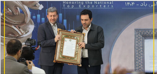
آقای مهندس اسدی فرماندار شاهین شهر و میمه، آقای مهندس کشانی رییس اتاق بازرگانی اصفهان، آقای مهندس کیانی شهردار شاهین شهر، سرهنگ ابراهیمی فرمانده ناحیه مقاومت بسیج

دکتر مهدی جمالی نژاد استاندار اصفهان و شماری از نمایندگان مجلس و مقامات ارشد استان اصفهان از پروژه بزرگ FRW که پس از شش سال تلاش شبانه روزی کارکنان و مهندسی پالایشگاه نفت سپاهان در چارچوب فعالیت‌های مطالعاتی و اجرایی، فاز اول آن وارد مرحله بهره‌برداری شده است، بازدید به عمل آوردند. به گزارش روابط عمومی شرکت نفت سپاهان، روز سه شنبه ۲۷ آبان ماه ۱۴۰۴ در بازدیدی ویژه دکتر مهدی جمالی نژاد استاندار اصفهان، دکتر حاجی دلگانی نماینده مردم اصفهان (برخورا) شاهین شهر (میمه)، مهندس فرهاد امین دهقان مدیرعامل شرکت نفت سپاهان و جمعی از مدیران و مسوولانی ارشد استان اصفهان، از مراحل اجرایی مختلف فاز اول پروژه FRW نفت سپاهان که از طرح‌های استراتژیک و بزرگ شرکت نفت سپاهان در راستای افزایش ظرفیت‌های تولیدی این شرکت به شمار می‌رود، بازدید کردند. در این بازدید ویژه که با حضور آقای دکتر جمالی نژاد استاندار اصفهان، دکتر حاجی دلگانی نماینده مردم اصفهان (برخورا) شاهین شهر (میمه) در مجلس شورای اسلامی، آقای مهندس فرهاد امین دهقان مدیرعامل شرکت نفت سپاهان، آقای دکتر احمدی فرماندار اصفهان، حجت الاسلام باقریان امام جمعه شاهین شهر،