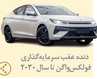
دنده عقب سرما به‌گذاری فولکس‌واگن تا سال ۲۰۳۰

صاحب امتیاز: موسسه مطبوعاتی دانش پیام بامداد نوین مدیر مسئول: کریم حسن پور سرمدبیر: جمشید بیرامی چاپ: جام جم آدرس: تهران، بلوار مردزادان، خیابان البرز، البرزیکم، پلاک ۶ تلفن: ۰۲۱-۴۹۱۰۵۰۰۰ گستره توزیع: سراسری شرکت توزیع: نشر گستر