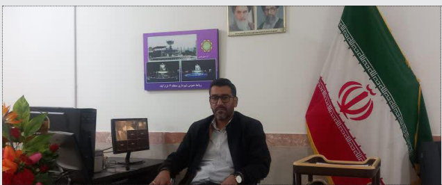
شهردار ناحیه ماسور با اشاره به تجدید نظر و رعایت اصول قانونی راه و راهور در ورود و خروج این ناحیه گفت: «با ایجاد دور برگردان در ناحیه ماسور پاین تر از بارفروشی برای جلوگیری از

تخلفات رانندگی در لاین کند رو به این رسلانه قول مساعد داد که در شورای ترافیک شهری این موضوع مطرح و بررسی شود.»