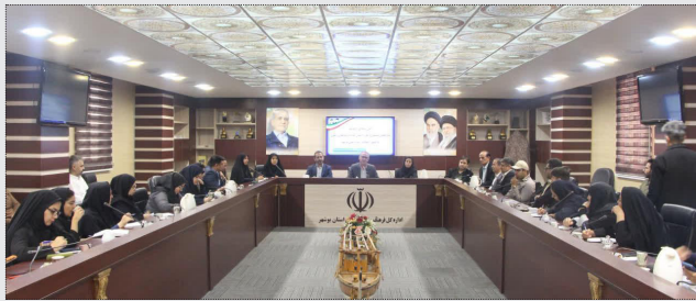
مدیر کل فرهنگ و ارشاد اسلامی استان بوشهر افزود: شناسایی، معرفی و تکریم پدیدآورندگان آثار فاخر داستانی از اهداف اصلی این جشنواره است و در کنار آن تولید محتوای فرهنگی برای

انتشار در رسانه های اجتماعی و ایجاد جریان فرهنگی هدفمند نیاز دنبال می شود. زندویان با اشاره به حساسیت تولید آثار داستانی برای گروه سنی کودک و نوجوان تصریح کرد: داستان نویسی در این حوزه نیازمند دقت، حساسیت و شناخت دقیق زبان، روحیات و نیازهای این قشر است و باید با رویکرد تربیتی، آموزشی، علمی و در عین حال سرگرم کننده انجام شود وی با بیان اینکه در سطح ملی برای حوزه داستان نویسی کودک و نوجوان نیازمند تقویت جدی هستیم خاطرنشان کرد: هدف ما این است که با توجه به جایگاه کودکان و نوجوانان به عنوان سرمایه های آینده کشور، بستری مناسبی برای پرورش فرهنگی، علمی و اجتماعی آنان فراهم شود مدیر کل فرهنگ و ارشاد اسلامی استان بوشهر در پایان بر ضرورت حضور فعال کودکان و نوجوانان در عرصه های فرهنگی، هنری، قرآنی و رسانه ای تأکید کرد و گفت: این حضور موجب کسب تجربه، آموزش مؤثر و تربیت مسئولانه نسل آینده خواهد شد. روابط عمومی اداره کل فرهنگ و ارشاد اسلامی استان بوشهر