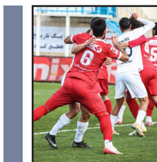
پر سپولیس چند بادکنک داخل زمین دارد