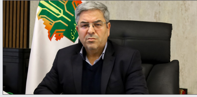
بخش زراعت ۱۱ هزار میلیارد ریال، دامداری ۶ هزار و ۶۰۰ میلیارد ریال، باغداری ۳ هزار و

۲۰۰ میلیارد ریال و توسعه گلخانه‌ها یک هزار و ۴۰۰ میلیارد ریال تسهیلات به متقاضیان پرداخت شد. مدیر شعب بانک کشاورزی آذربایجان شرقی در ادامه به تکالیف قانونی در حوزه حمایت از خانواده اشاره کرد و گفت: در راستای قانون جوانی جمعیت، ۲ هزار میلیارد ریال تسهیلات قرض‌الحسنه ازدواج و فرزندآوری به واجدان شرایط پرداخت شده است. وی همچنین میزان تسهیلات ارزان‌قیمت نوسازی و بهسازی مسکن روستایی را ۹ هزار و ۹۰۰ میلیارد ریال اعلام کرد. وی خاطرنشان کرد: در بخش اشتغال حامیانی نیز از محل جزء ۱ و ۲ بند ۷ تبصره ۱۵ و ۱۸ قانون بودجه، مبلغ یک هزار و ۸۰۰ میلیارد ریال اعتبار تخصیص یافت. علاوه بر این، ۲۱۰ میلیارد ریال تسهیلات ارزان‌قیمت به جامعه عشایری و ۲۴۹ میلیارد ریال تسهیلات قرض‌الحسنه برای مسکن محرومین روستایی در نظر گرفته و پرداخت شده است.