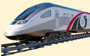
سفر سریع‌تر حجاج با قطارهای جدید

صاحب امتیاز: موسسه مطبوعاتی دانش پیام بامداد نوین مدیر مسئول: کریم حسن پور سردبیر: جمشید بیرامی چاپ: جام جم آدرس: تهران، بلوار مردزادان، خیابان البرز، البرزیکم، پلاک ۶ تلفن: ۰۲۱-۴۹۱۰۵۰۰۰ گستره توزیع: سراسری شرکت توزیع: نشر گستر