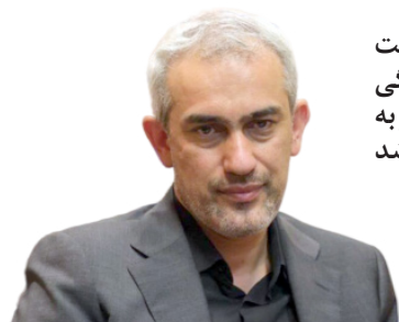
مدیریت هماهنگی مرزهای کشور به گمرک سپرده شد