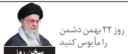
روز ۲۲ بهمن دشمن را مایوس کنید