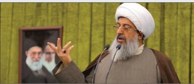
وی می‌کنند (کشتن هموطن و تخریب اموال مردم).

وای با تأکید بر اینکه امپراتوری آمریکا (هژمونی و سلطه جهانی آن) در حال زوال است و محاسبات دشمن در شناخت ملت ایران غلط بوده است، بر لزوم برخورد شدید دستگاه قضایی با کسانی که با حرف، تحلیل یا عمل با دشمن همکاری کردند، تأکید کرد و گفت: این برخورد باید درس عبرت باشد تا دیگران هوس کودتا نکنند.