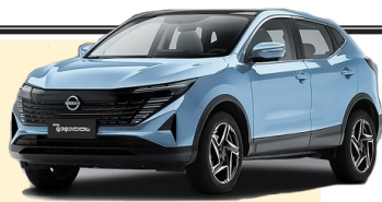
شرایط فروش نسیان سیلفی E-Power و قشقایی

قابل عرضه این محصول شامل سفید و مشکی می‌شود. همچنین کراس اوور بعدی این شرکت، نسیان قشقایی آن است که با بهای قطعی ۵ میلیارد و ۵۰۰ میلیون تومان عرضه خواهد شد. مدل و رنگ‌بندی و موعد تحویل مثل خودرو سیلفی است. حداکثر مهلت متقاضیان برای واریز وجه تا پایان مهلت ثبت نام بوده و پس از آن مشتریان رزرو جایگزین می‌شوند. با این اوصاف در موعد مقرر نسبت به ثبت نام و واریز وجه اقدام کنید، در غیر این صورت هیچ مسئولیتی متوجه شرکت نخواهد بود. رنگ محصول براساس ظرفیت و اولویت درخواست و واریز وجه توسط متقاضیان انتخاب می‌شود.