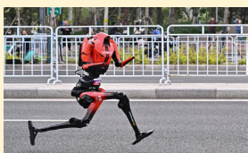
ریات‌ها در نیمه‌ماراتن پکن از انسان‌ها سبقت گرفتند

صاحب امتیاز: موسسه مطبوعاتی دانش پیام بامداد نوین مدیر مسئول: کریم حسن پور سردبیر: جمشید بیرامی چاپ: جام جم آدرس: تهران، بلوار مردزادان، خیابان البرز، البرزیکم، پلاک ۶ تلفن: ۰۲۱-۴۹۱۰۵۰۰۰ گستره توزیع: سراسری شرکت توزیع: نشر گستر