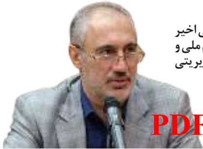
جنگ تحمیلی اخیر نماد انسجام ملی و مدیریتی