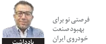
فرصتی نو برای بهبود صنعت خودروی ایران