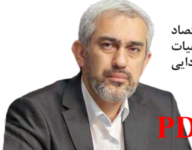
ایجاد کار گروه اقتصاد دیجیتال در هیات مقررات‌زادایی