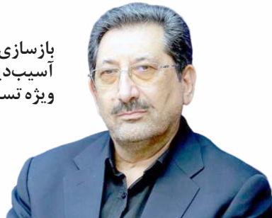
بازسازی واحدهای آسیب‌دیده با ساز و کارهای ویژه تسریع می‌شود