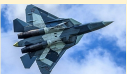
روسیه جنگنده Su-57 را برای صادرات آماده می‌کند

صاحب امتیاز: موسسه مطبوعاتی دانش پیام‌امداد نوین مدیر مسئول: کریم حسن پور سردبیر: جمشید بیرامی چاپ: جام جم آدرس: تهران، پلوار مردزادان، خیابان البرز، البرزیکم، پلاک ۶ تلفن: ۰۲۱-۴۹۱۰۵۰۰ گستره توزیع: سراسری شرکت توزیع: نشر گستر