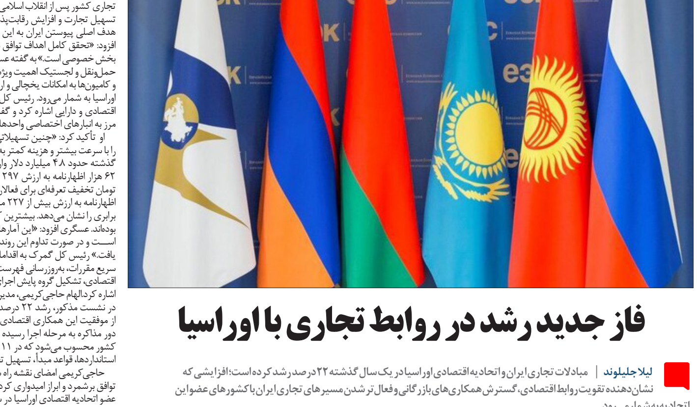
در راستای توسعه روابط اقتصادی با اوراسیا، دولت ایران با تسهیل فرآیندهای تجاری و رفع موانع غیرتعرفه‌ای، زمینه‌ساز افزایش مبادلات تجاری با کشورهای عضو این اتحادیه اقتصادی شده است.

می‌روند. بنابر این همکاری میان دستگاه‌های اجرایی، گمرکی و استاندارد ی دو طرف می‌تواند هزینه مبادلات را کاهش داده و زمینه حضور پایدارتر صادرکنندگان ایرانی در بازارهای منطقه‌ای را فراهم کند.