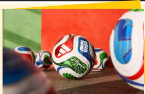
توپ جام جهانی ۲۰۲۶ قوانین آیرودینامیک

طراحی عجیب و چهار پل توپ جام جهانی ۲۰۲۶ با نام ترینوندا قواعد فیزیک را تغییر داده و برد شوت‌های بلند بازیکنان را در مسابقات کاهش می‌دهد. شرکت آدیاس با رونمایی از توپ جام جهانی ۲۰۲۶ با نام ترینوندا قواعد سنتی فیزیک در فوتبال را دگرگون کرده است. این توپ با ساختاری مشابه چهار پل خود مسیر حرکت در هوا را تغییر می‌دهد و بر نتایج مسابقات پیش رو تأثیری مستقیم خواهد گذاشت. ترینوندا نخستین توپ تاریخ مسابقات مردان است که تنها با چهار پل حرارتی ساخته می‌شود. این طراحی سرهنگ نماد