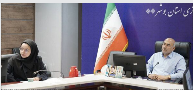
معاونت شبکه معابر، نحوه توسعه فیزیکی شهر، تأمین سرانه‌های خدماتی و انطباق پیشنهادها با اسناد فرادست و ضوابط شهرسازی بررسی شد. زارع تصریح کرد: طرح جامع به‌عنوان مهم‌ترین

سند هدایت و مدیریت توسعه شهری، نقش تعیین‌کننده‌ای در ساماندهی روند رشد شهر، حفظ تعادل میان کاربری‌ها و تأمین زیرساخت‌های مورد نیاز شهروندان دارد و به همین دلیل لایحه‌ی پیشنهادها با نگاه کارشناسی و مبتنی بر مطالعات فنی ارزیابی می‌شود. وی ادامه داد: توسعه متوازن شهر، ارتقای کیفیت محیط شهری، تأمین نیازهای سکونتی و خدماتی شهروندان و حفظ ظرفیت‌های ارزشمند محیطی از مهم‌ترین اهداف بازنگری طرح جامع شهر بوشهر است. معاون شهرسازی و معماری اداره کل راه و شهرسازی استان بوشهر خاطر نشان کرد: جمع‌بندی مباحث مطرح‌شده و نظرات دستگاه‌های اجرایی پس از تکمیل بررسی‌های کارشناسی در مراجع ذیصلاح مطرح و تصمیمات نهایی درباره بازنگری طرح جامع شهر بوشهر اتخاذ خواهد شد.