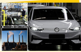
حذف ۱۰۰ هزار شغل در فولکس واگن

صاحب امتیاز: موسسه مطبوعاتی دانش پیام بامداد نوین مدیر مسئول: کریم حسن پور سرمدیر: جمشید بیرامی چاپ: جام جم آدرس: تهران، بلوار مرزداران، خیابان البرز، البرزیکم، پلاک ۶ تلفن: ۰۲۱-۴۹۱۰۵۰۰۰ گستره توزیع: سراسری شرکت توزیع: نشر گستر